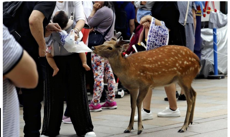
A deer tries to snatch a plastic bag held by a tourist in Nara Park on June 14.

◆ 国の天然記念物に指定されている奈良のシカの胃から、レジ袋などの異物が相次いで見つかっています。