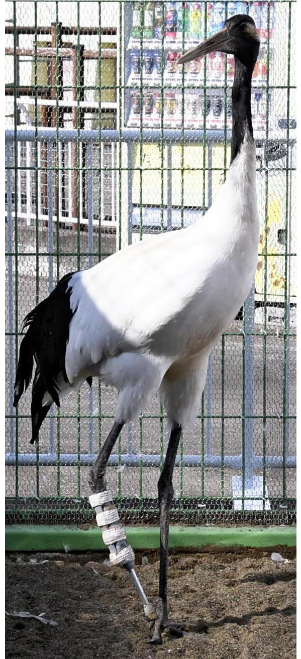
義足を付けたタンチョウ

かつて絶滅の危機にひんしたタンチョウは、人工給餌などが実を結び、今では全道で1600羽以上に増えた。同時に生息域が人間の生活圏と重なるようになり、車にはねられたり、フェンスに絡まったりする例が後を絶たない。傷ついたり死んだりして保護・回収される数は、1970年代頃には年間10羽ほどだったが、2000年代に入ると20～30羽に増え、19年は初めて40羽を超えた。