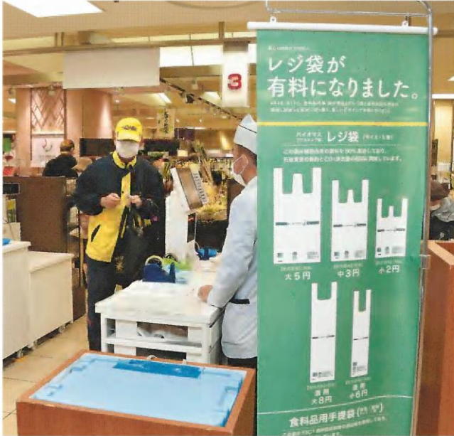
今月1日レジ袋を有料にした高島屋横浜店。エコバッグを持参する客が多い