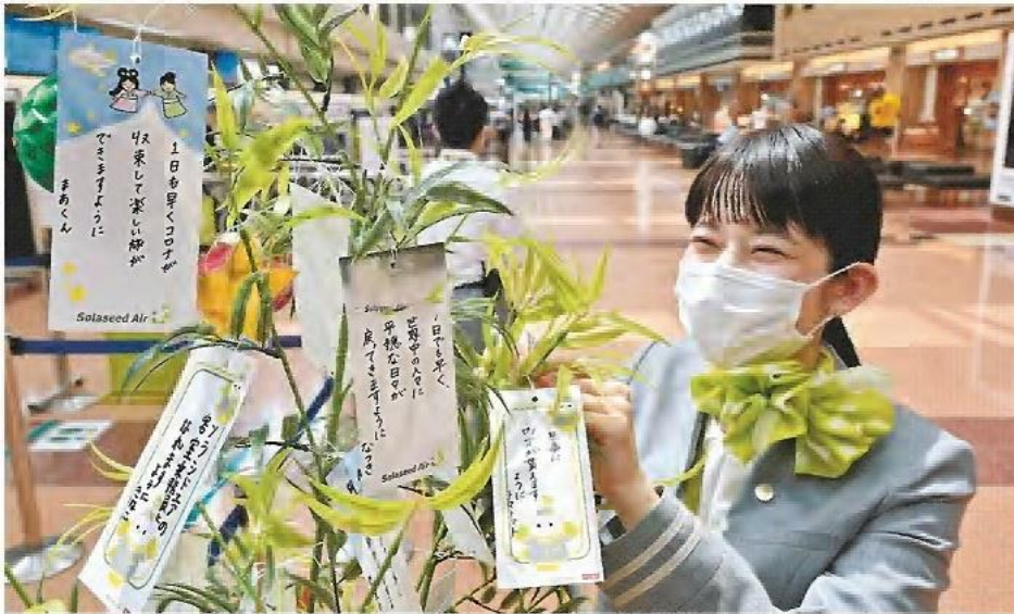
A Solaseed Air ground staff member attaches tanzaku strips of paper to bamboo at Haneda Airport in Ota Ward, Tokyo, on Friday.