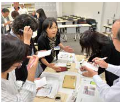
活発な意見が交わされる「土曜サロン」

新聞を活用した学習方法について探る、先生向けの勉強会を原則毎月第4土曜日の14時～16時半に開いています。