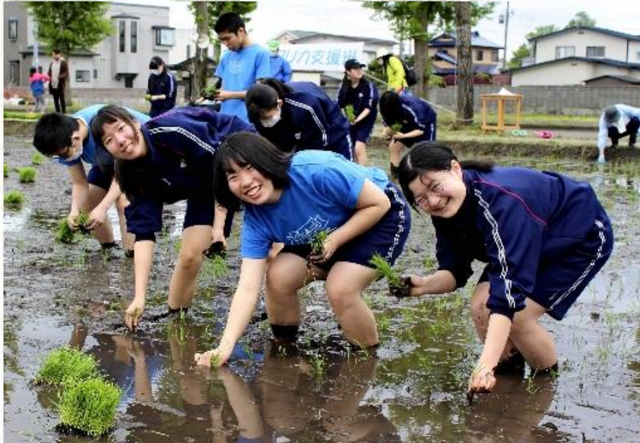
あきたこまちの苗を植える大館国際情報学院高校の生徒ら(23日、大館市で)

供たちを救おうと、支援米の田植えが23日、大館市大田面で行われ、約40人が参加した。市民団体「食とみどり」と