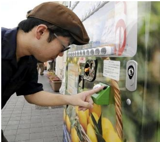
ボタンを押すと香りが噴き出す自動販売機

水を購入しなくても無料で楽しめる。ウエルネスパーク五色（洲本市）や美菜恋来屋（南あわじ市）など9か所に設置。同事務所は「収穫期だけでなく、香りを通して一年中、淡路島なるとオレンジを知ってもらえれば」と話している。