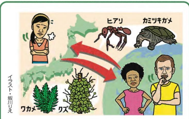
イラスト・坂川りえ

ワカメ 外国では迷惑 ヒアリは意外にも、故郷南アメリカ大陸ではほかのアリより弱く、ジャンブルを追われて川沿いでひっそり暮らしているそうです。 世界外来種ワースト100に 逆に、日本ではごく普通に生息する生物が、海外では「外来種」として力を振るい、迷惑がられているケースもあります。 おみそ汁に入っている「ワカメ」もその一つ。その昔、