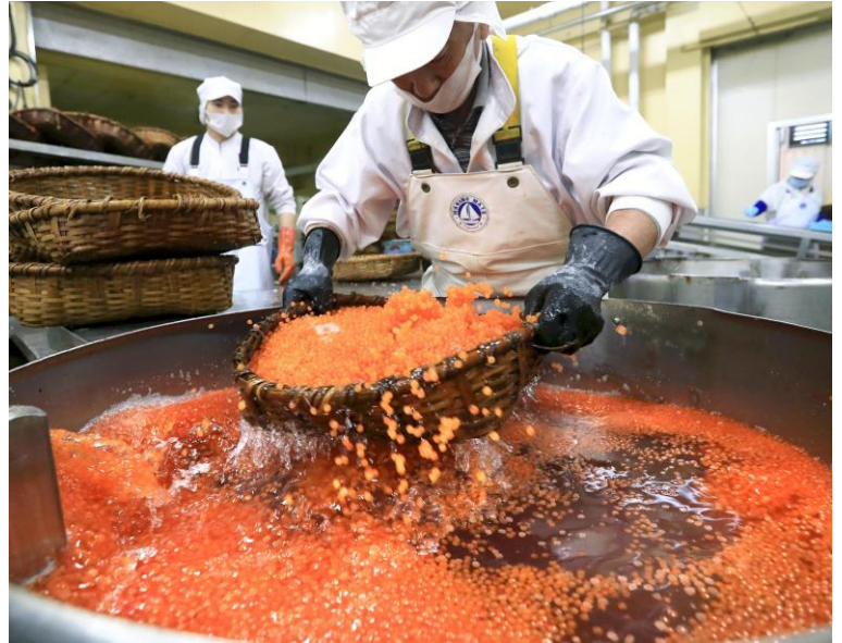
Employee process salmon roe at a Marua Abe Shoten factory