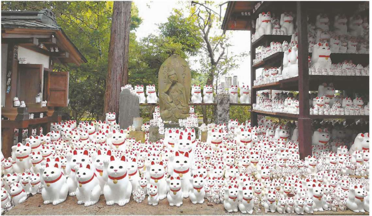
同じ形の招き猫が並んでいたり、数や大きさや色や姿勢が異なる招き猫が並んでいたり、それぞれが個性をみせている。