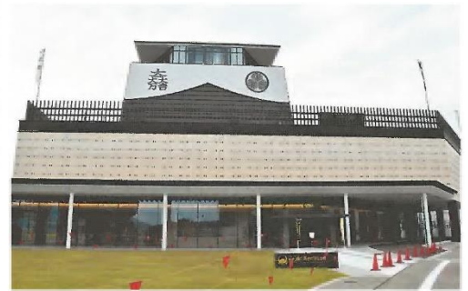
岐阜関ヶ原古戦場記念館

せきが はら しょうかい ◆関ヶ原の戦いを紹介する「岐阜関ヶ原古戦場記念館」が、岐阜県関ヶ原町にオープンしました。