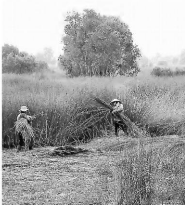
レビロニアを収穫するベトナムの農家