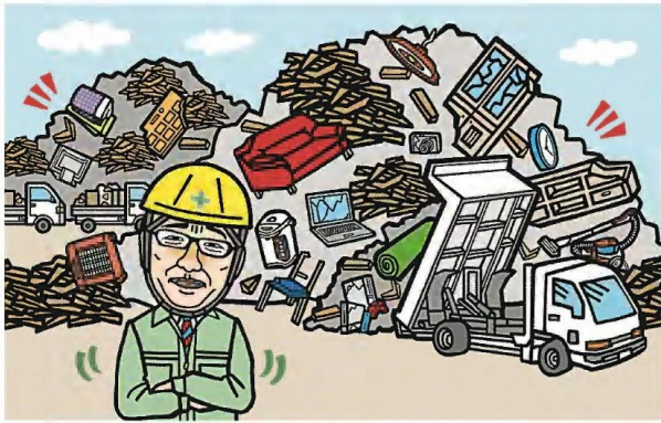
イラスト・坂川リえ

台風や地震といった災害のたびに問題となるのが「災害ごみ」です。ごみがある、被災地の復興がうまく進まないからです。少しでも早くごみを片付ける力として、「分別」が注目されています。