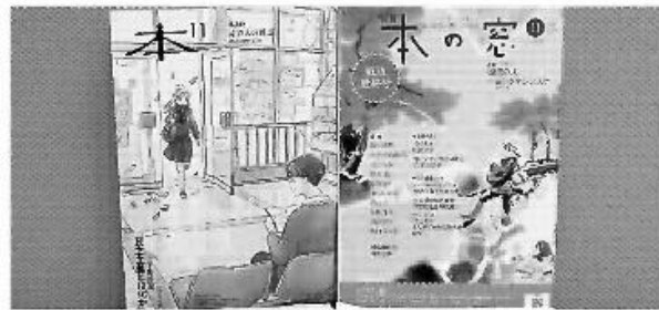
休刊するPR誌「本」(左)とウェブ版に移行する「本の窓」