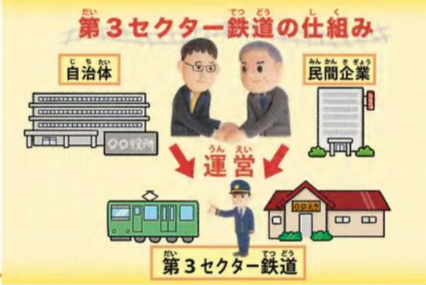
イラスト・たまいはるこ

民間と自治体 一緒に運営 第1セクターは、国や都道府県、市町村などの行政のこと、第2セクターは民間の会社を意味しています。第3セクター(3セク)は、行政と民間が一緒にお金を出し合っ 作る会社のことをいいます。民間の会社は、赤字が出続けると借金がふくらみ、倒産してしまいます。でも、鉄道の場合、運営する会社が倒産してしまうと社会が混乱し、地域の人々が困ってしまいます。 こうした生活に密着した業種は、3セクが運営し、赤字になった分のお金を行政が穴埋めして、地域の利便さを守っています。とはいえ、行政が出しているお金は、みんなから集めた税金です。いくらでもお金を出せるわけではありません。民間が持っている経営のアイデアを生かし、できるだけ赤字をなくす必要があります。