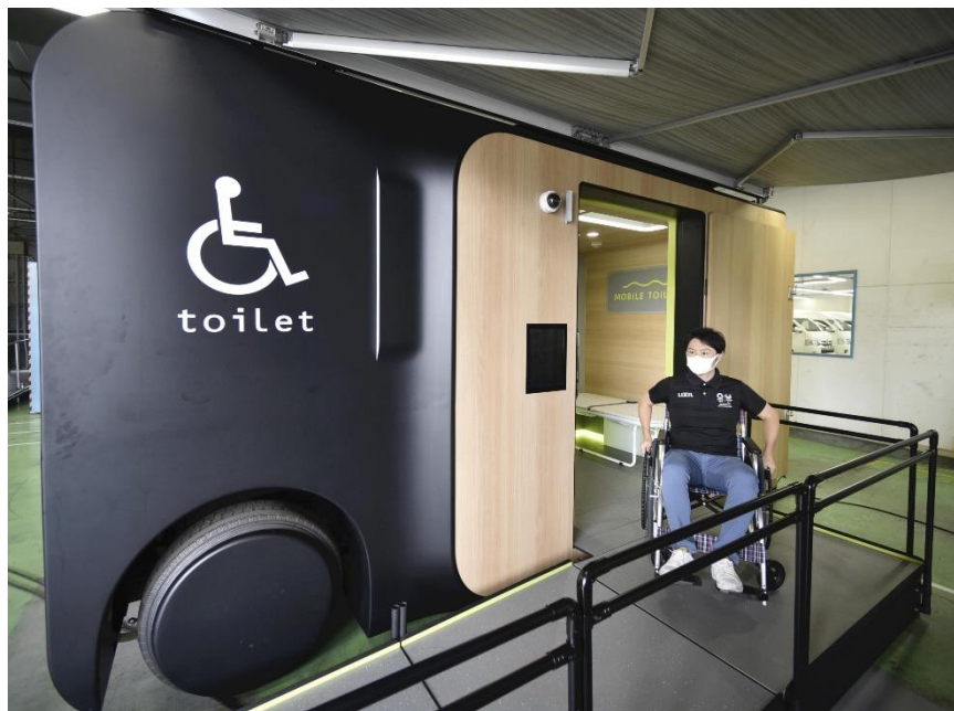
(2021年8月19日 読売新聞夕刊より)

24日に開幕する東京パラリンピックに向け、トヨタ自動車と住宅設備大手LIXIL（リクシル）は、共同開発した移動型バリアフリーの「モバイルトイレ」の準備を進めている。