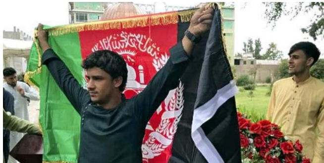
アフガン国旗を掲げて抗議の意志を示す市民