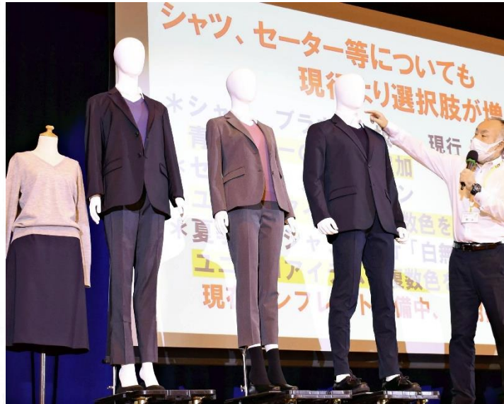
説明会で紹介された新しい制服（9月25日、さいたま市立大宮北高校で）

のものを着ることもできるが、女子は高校入学時に新調しなくてはならない。ウール100%で洗濯しにくく、保護者からは「価格が高い」との指摘もあった。コロナ禍での厳しい経済的負担も考慮して、同校は5月から新たな制服を検討してきた。ユニクロ製はポリエステル素材などで伸縮性が高く、自宅の洗濯機でも洗える。女子もズボンを選べるなどジェンダーレスの着こなしが可能だ。ただ、生徒の身長によってはサイズ対応できない場