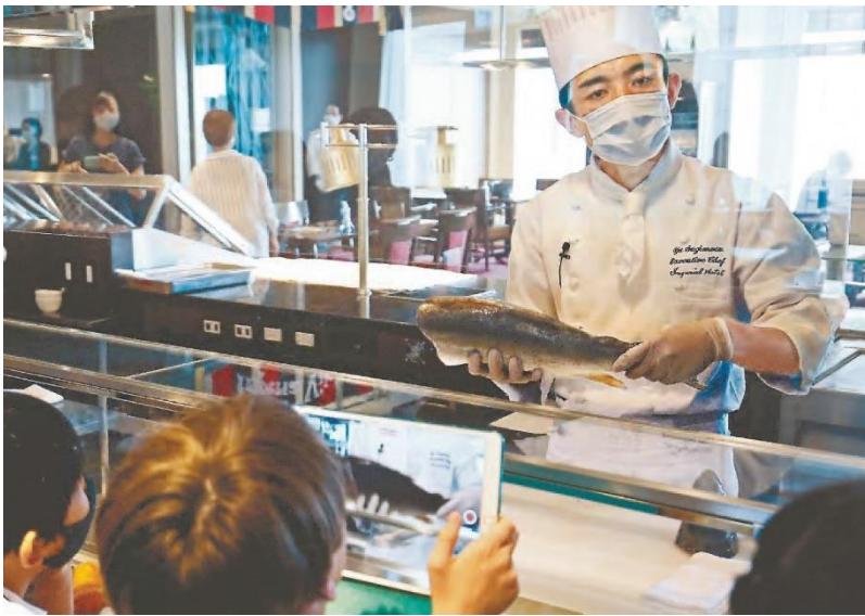
食品ロスについて考える食育セミナーを8月に開いた。「無駄を出さず、食材を余すところなく味わってもらおうという料理観を大事にしていきたい」(東京都千代田区の帝国ホテルで)

ました。ホテルでは最上品しか使いませんから、キャベツの葉の硬い部分や、飲み頃を少しでも過ぎたワインは廃棄されてしまう。でも、これらをパウダー状に加工して天然塩と混ぜれば、風味のあるオリジナルの塩ができます。