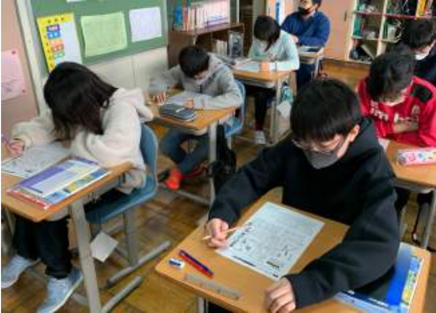
紋別小学校（北海道紋別市）での取り組み（2021年度）