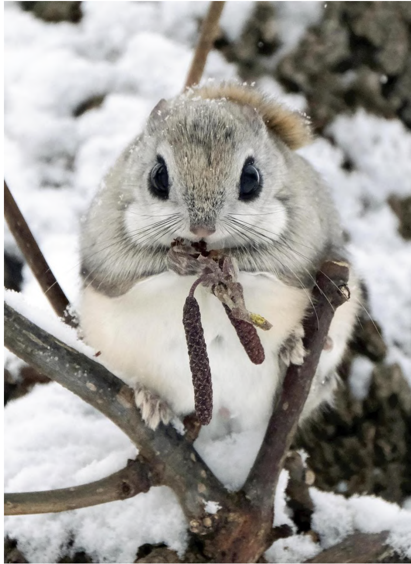
目をくりっとさせ、ほおばる姿が愛らしいエゾモモンガ(2月16日、十勝地方の森林で)