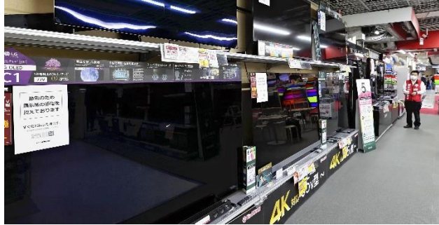
「電力需給逼迫警報」を受け、展示用テレビの電源を落とした家電量販店（22日午後、東京都新宿区で）

東日本で22日、大規模停電が懸念されるほど電力の需給が逼迫した。最大の要因は、福島県沖の地震で複数の火力発電所が停止した状態で、想定外の厳しい寒さにより暖房需要が増えたことだった。火力の早期復旧は難しく、猛暑に向けた対応策が求められる。