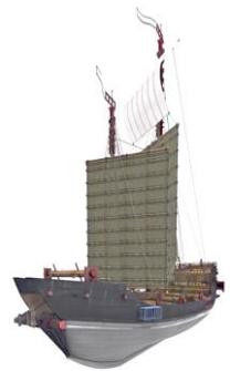
コンピュータグラフィックスで再現された元寇船

鎌倉時代の「元寇」の古戦場として知られる長崎県松浦市・鷹島沖の国史跡「鷹島神崎遺跡」近くの海底から10月、元寇船の木製いかりが引き揚げられる。2013年に水深約20メートルの海底で発見、保護されてきたが、陸上での保存に向けた準備が整った。近くには元寇船2隻が沈んでおり、初の船体引き揚げを見据えている。