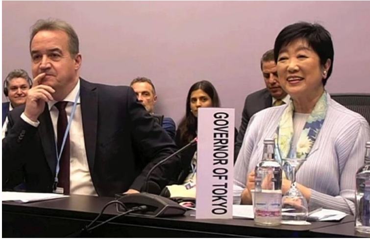
COP27には東京都の小池知事(右)も出席した(8日)