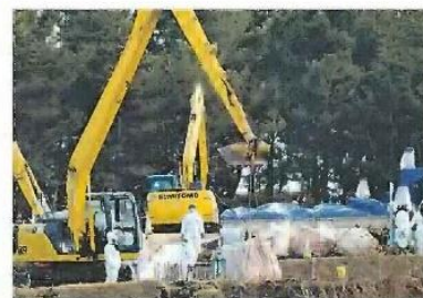
殺処分したニワトリを埋める作業員たち（昨年12月24日、青森県三沢市で）

鳥インフルは通常、ウイルスを持った渡り鳥がロシア・シベリアから越冬のために南下することで広が