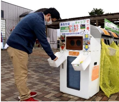
分別したキャップで投票する利用客(11月4日、新潟市西区の黒埼パーキングエリアで)

は犬派？猫派？」を5月中旬に始めたところ、分別率は約6割に改善された。回答は犬派が多かった。第1弾で手応えをつかんだ同事業所は10月まで第2弾「新潟といえは『米』？それとも『酒』？」を実施。結果は米が多数派だったが、分別率は5割ほどに低下してしまっ