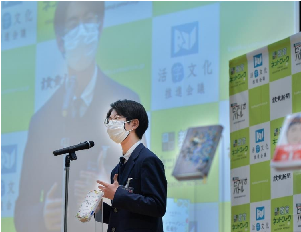
（第5回全国中学ビブリオバトルの様子、2022年3月）

中学生が愛読書を紹介しあう「第6回全国中学ビブリオバトル」（活字文化推進会議主催、昭和女子大学特別協力、文部科学省などの後援）の開催が決まりました。たくさんの中学生の出場をお待ちしています。日時会場は下記の通りです。