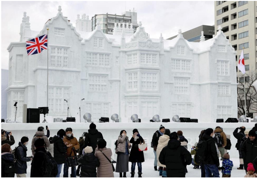
「さっぽろ雪まつり」が開幕し、エンブリー荘の大雪像を楽しむ観光客（4日午前、札幌市中央区で）