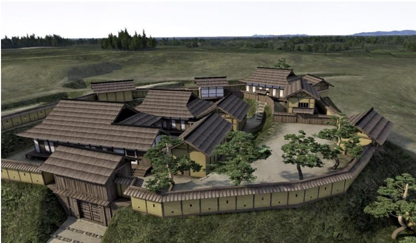
か そう げん じつ かく ちょう