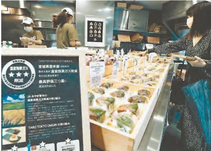
温室効果ガス削減の「三つ星」米の使用を知らせているおにぎり店（東京・虎ノ門の「TARO TOKYO ONIGIRI」で）