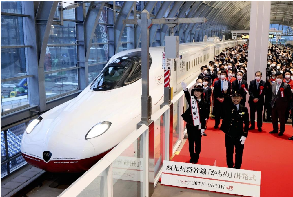
長崎駅を発車する西九州新幹線「かもめ」の一番列車（23日午前6時17分、長崎市で）