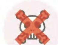
不適切な投稿を表示しない