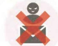
メッセージの受け取りを制限