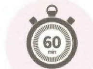
1日1時間超の利用で通知

て、世界では法律などで未成年のSNS利用を制限する動きが広がっている。日本でも昨年11月、政府がインターネットに詳しい専門家などを集めた検討会を作り、対策を議論している。