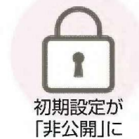
初期設定が「非公開」に

SNS利用の低年齢化が進み、未成年者が犯罪に巻き込まれるなどのトラブルが相次いでいることを受け