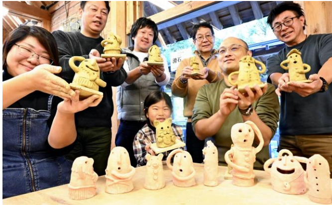
①完成した埴輪を手にする埴輪づくり教室の参加者たち ②宮崎県立西都原考古博物館で展示されている「子持家」のレプリカ