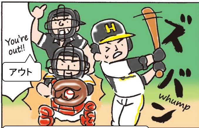
その調子で頑張れ、ミーちゃん