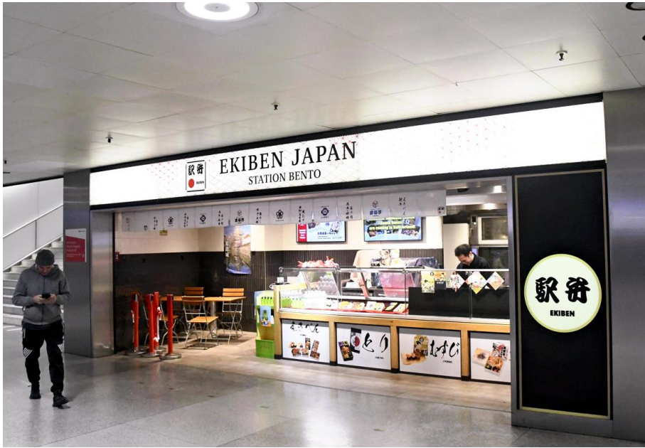
5日、スイス・チューリヒ中央駅内の駅弁販売店では開店に向けた準備が進んでいた。

◆日本の会社が、駅弁をヨーロッパの人たちに食べてもらおうという試みを始めました。