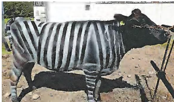
白い塗料でシマウマのような模様になったウシ

科学 「シマウマ模様の牛には虫がつきにくくなる」ことを突き止めた日本のグループの研究が今月、クスッと笑えて、考えさせられる科学的な研究に贈られる「イグ・ノーベル賞」を受賞した。ユニークな研究成果は、どうやって導き出されたのだろうか。