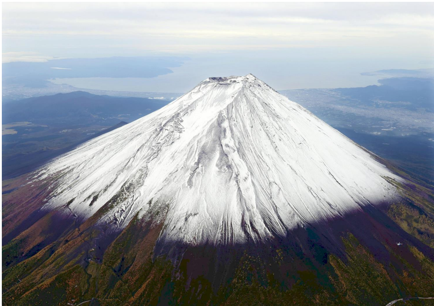
初冠雪を観測した富士山。奥は駿河湾（23日午前、本社ヘリから）

にほん いちばんたか やま こん き はじ ゆき さんちよう しろ み はつかんせつ かんそく ◆日本で一番高い山で今季初めて雪がつもり山頂が白く見える「初冠雪」が観測されました。