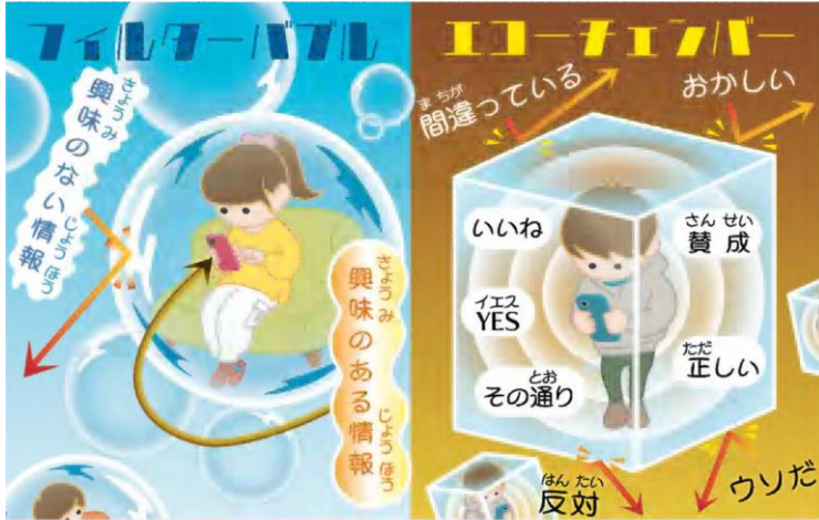
イラスト・楠本礼子