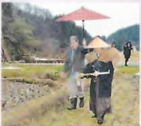
田の神様に感謝する石川県・奥能登の伝統行事「あえのこと」

後世に伝えるべき伝統芸能や祭り、工芸技術といった「形のないもの」を、ユネスコ（国連教育・科学・文化機関）が、保護する対象として登録している。登録数は世界で716件。日本からは「能楽」や「歌舞伎」といった伝統芸能や、「和食」、「伝統的酒造り」など23件が登録されている。建築や豊かな自然など形のあるものは「世界遺産」として登録される。