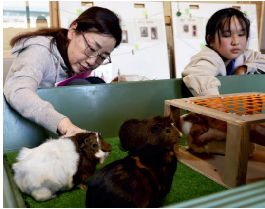
モルモットとふれあうボランティアたち(4月、甲府市で)

餌を食べてくれてうれしかった」と笑顔を見せた。げっ歯目テンジクネズミ科のモルモットはペットとしても人気があるが、人になれるまでは、なでられることに恐怖を感じたりストレスを抱えたりする場合があるという。園では約30匹のモルモットを飼育しているものの、